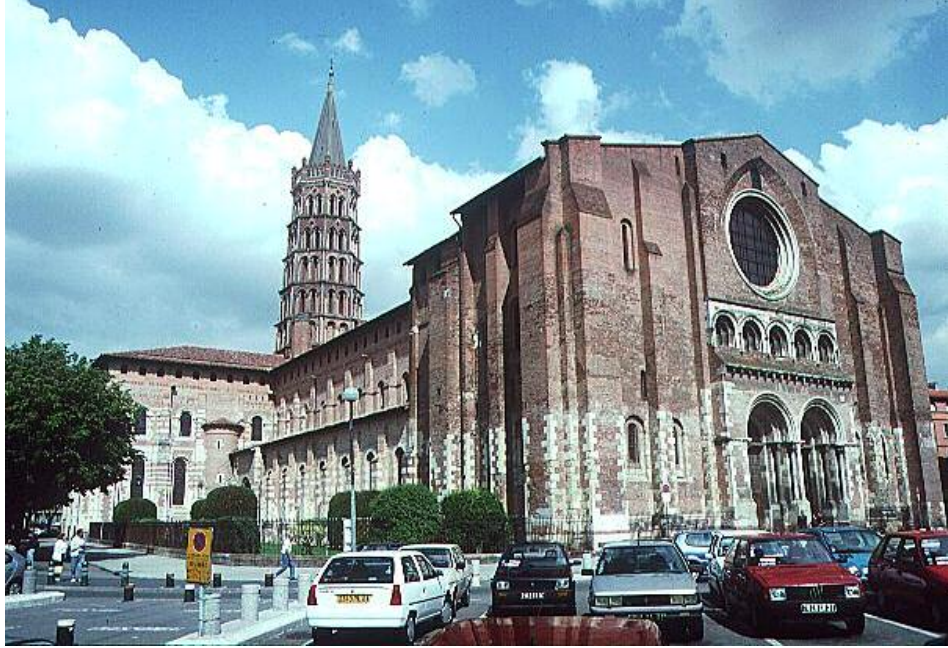
ديمهنيكي كليساى سان سرنان - شارى تولوز، فهپهنا St. Sernin